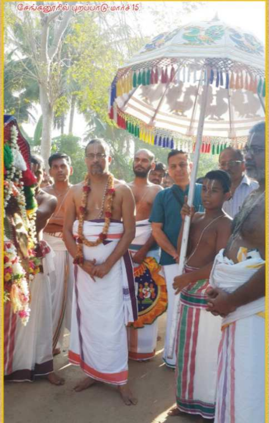
சேங்கனூரில் புறப்பாடு மார்ச் 15