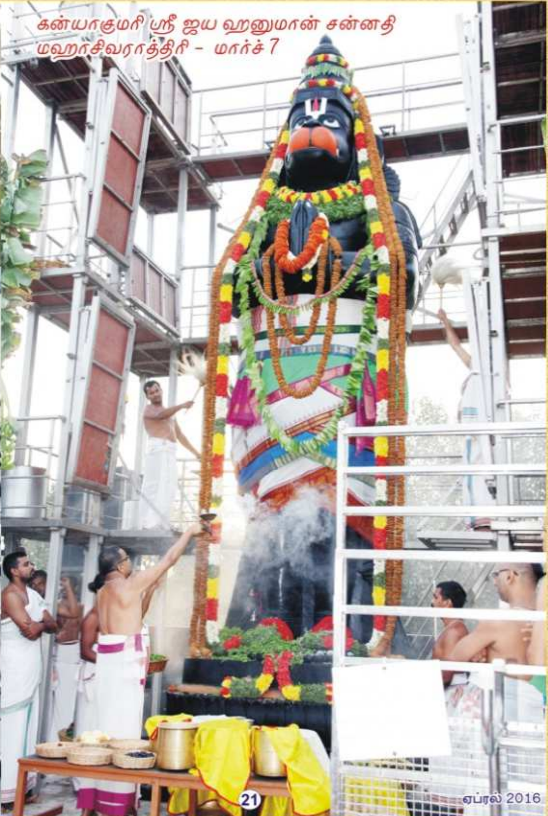
கன்யாகுமரி ஸ்ரீ ஜய ஹனுமான் சன்னதி மஹாசிவராத்திரி - மார்ச் 7