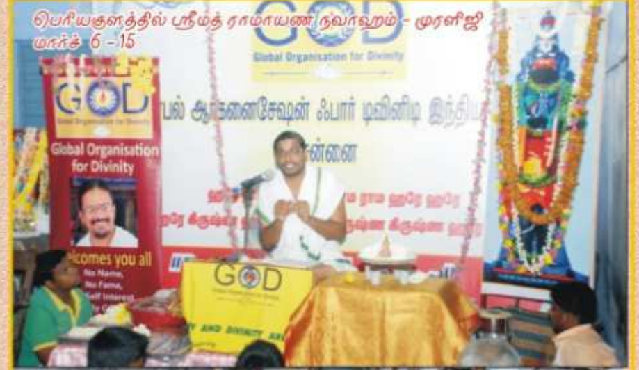
பெரியகுளத்தில் ஸ்ரீமத் ராமாயண நவாஹம் - முரளிஜி மார்ச் 6-15